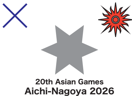
例8)OCAシンボル(太陽マーク)がアレンジされている(枠線がついている、ぼかされている、色が変わっている等)。