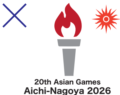
例4)オリンピックに関連した要素を含んでいる(五輪マーク、聖火、メダルなど)。