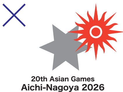
例6)OCAシンボル(太陽マーク)とエンブレムが重なりあっている。