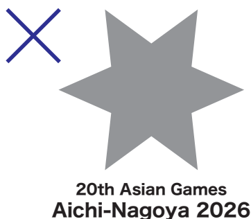
例2)OCAシンボル(太陽マーク)が含まれていない。