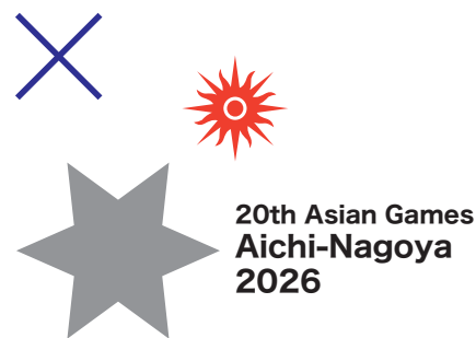
例3)大会名称がエンブレムの下に配置されていない。