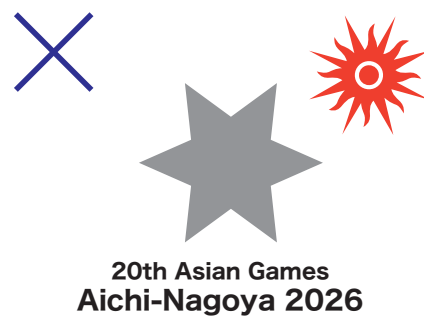
例7)OCAシンボル(太陽マーク)の向きが回転している。