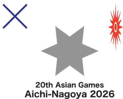
例5)OCAシンボル(太陽マーク)が変形している。